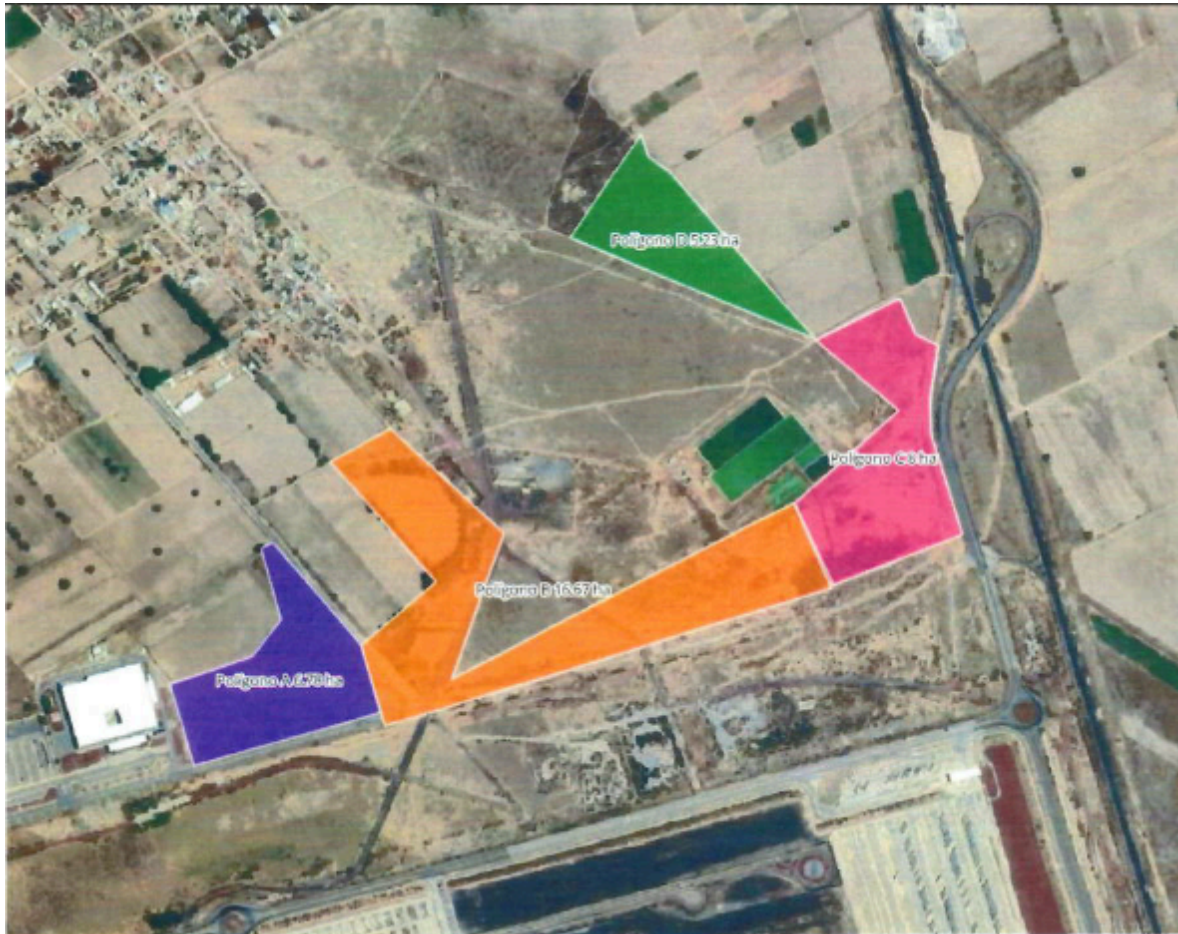
Figura 1. Mapa regional de ubicación del Polo de Desarrollo de Economía Circular para el Bienestar Puebla.